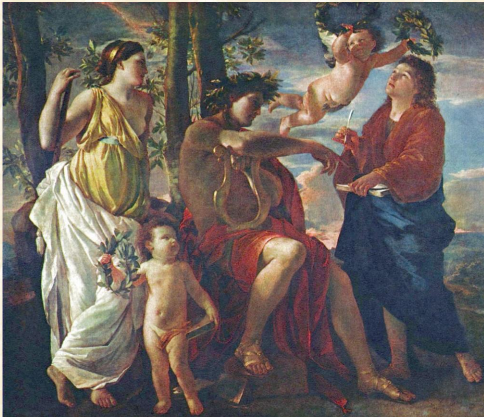
Nicolas Poussin, L'Inspiration du poète (1629) | Huile sur toile, Musée du Louvre, Paris

Universität de Berne | Universität Bern | University of Bern